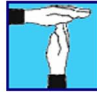
Demi - bouteille