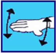
Ca va pas