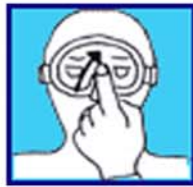
Equilibre ton masque