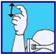
Purge ton gilet