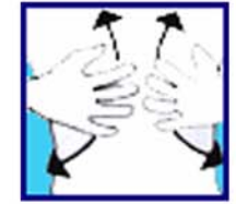
Je suis essoufflé