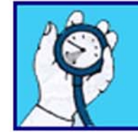
Montre ton manomètre