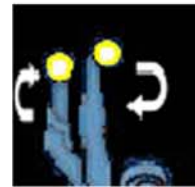
Ca va la nuit