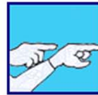
Conduis et je suis