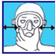
Equilibre tes oreilles