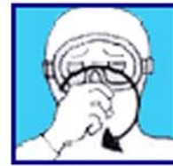
Je suis narcosé