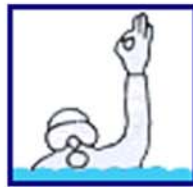
Ca va surface