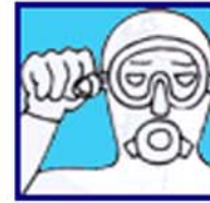
Je suis sur réserve