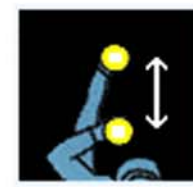
Ca ne va pas la nuit