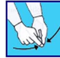
On se regroupe