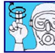
J'ai des vertiges