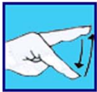
Palmage: plus d'amplitude