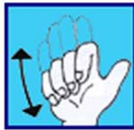
Gonfle ton gilet