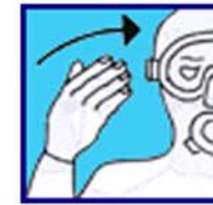
Venez vers moi