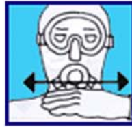
Panne d'air (Variante)