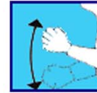
Difficulté passage réserve