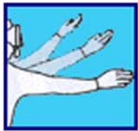
Prendre cette direction